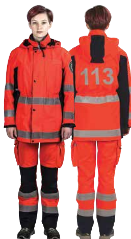
NEATLIEKAMĀS MEDICĪNISKĀS PALĪDZĪBAS DIENESTA BRIGĀDES DARBINIEKS