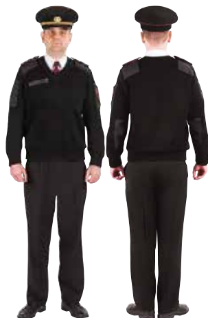
UGUNSDZESĒJS GLĀBĒJS UN INŠPEKTORS